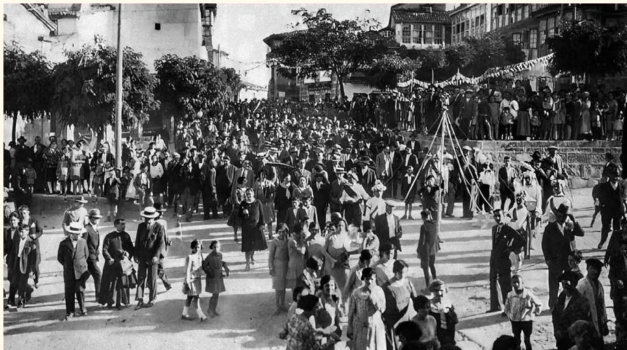
Danza das cintas, danza gremial da Unión de Agricultores de Maceda.

Nos anos 50, o Manueletas fíxose cun magnetófono alemán e foi gravando as actuacións que realizaron na taberna e despois da desaparición do grupo, os domingos facía bailes, coa música “enlatada” dos Gaiteiros de Xinzo!