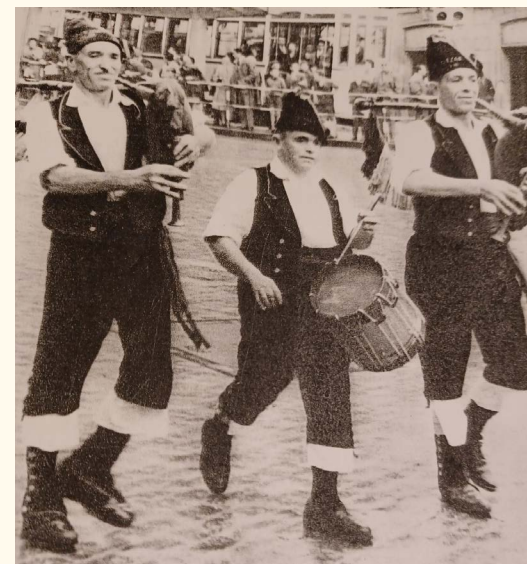
Outra actuación dos Dezas de Moneixas