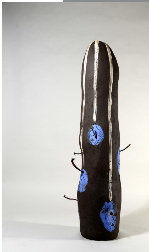
Cerámica metafísica V

Desde 1992 propiciou a progresiva creación de tres fundacións, en Valladolid, Nova York e Murcia, onde o seu desexo principal é devolver á sociedade, por medio da realización de actividades artísticas e culturais, creando conciencia a través das artes.