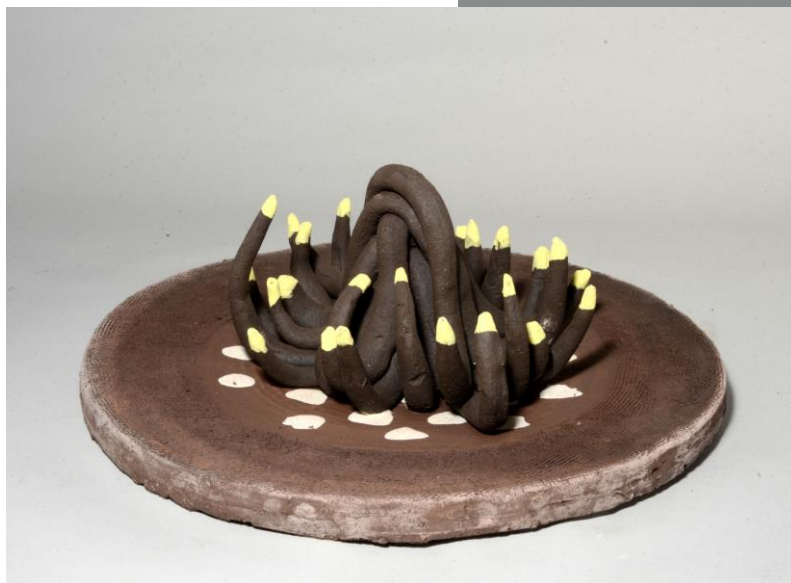
Cerámica metafísica XX

O mural para os Xogos Olímpicos de Barcelona 92 e o mural 'Atopo 92', para a Exposición Universal de Sevilla (1992), o gran proxecto escultórico 'Atlanta Star' (1996), a realización da obra 'Hope for Peace' (1986) como cartel oficial do cume ou a 'Capilla del Milenio' (2000-2001), supoñen un importante fito na súa traxectoria profesional, á vez que inician unha frutífera etapa creativa, que aínda hoxe día mantén, marcada pola colaboración con organismos internacionais como o IOC ou Nacións Unidas.