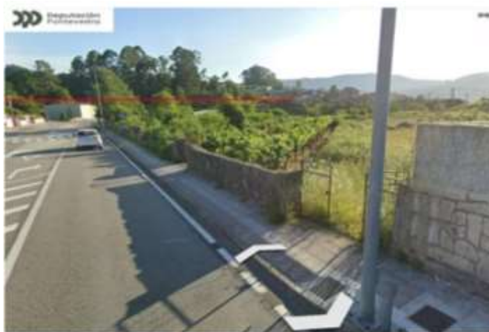
Foto do visor de Google Earth

Segundo.- Non existen escritos rexistrados nin partes de incidencias en ningún caso polo motivo sinalado como causa do accidente nese punto polo que o servizo non foi informado previamente da incidencia.